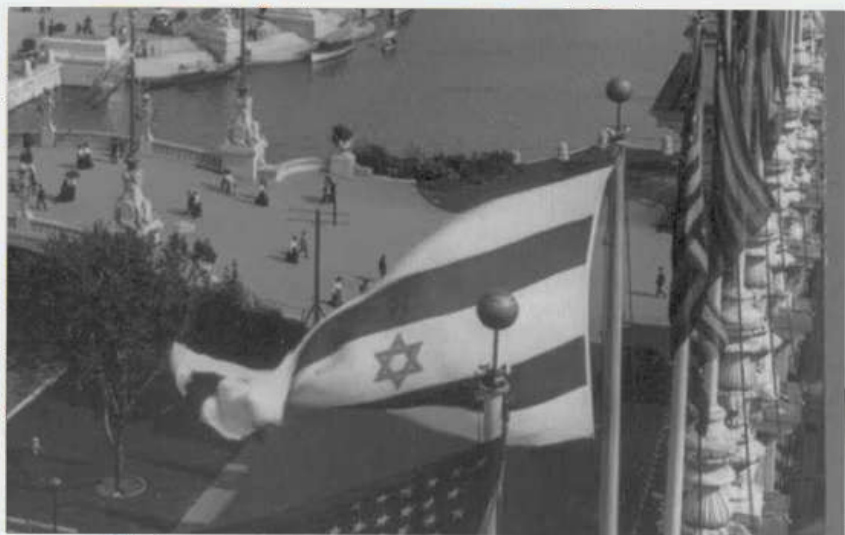
Exposition universelle de 1904 à Saint-Louis